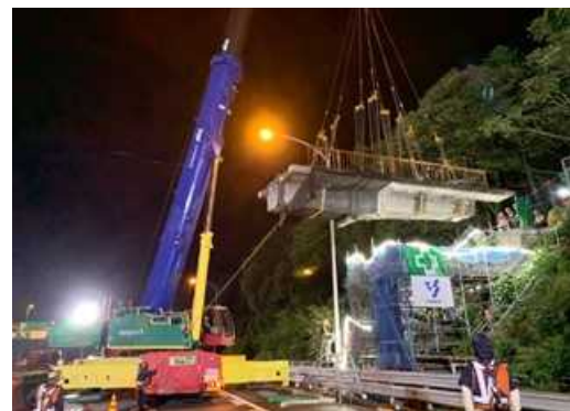
跨道橋の撤去状況