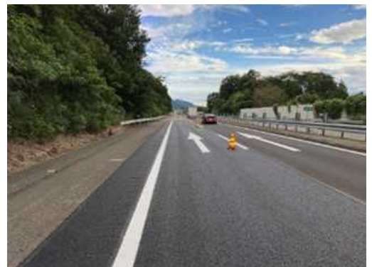
アスファルト舗装の施工状況