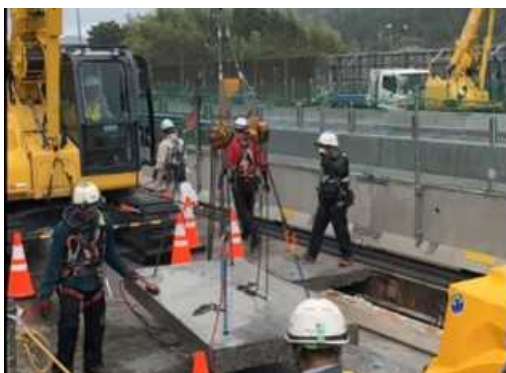
老朽化した床版の撤去状況