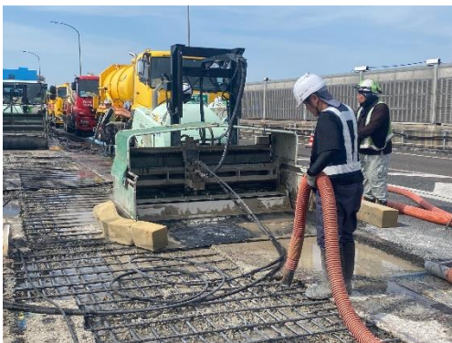
老朽化した床版の補修状況