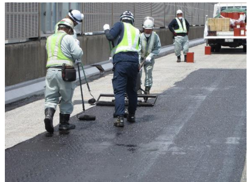
床版防水施工状況