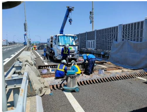
伸縮装置取替状況