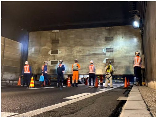
制水ゲートの点検状況