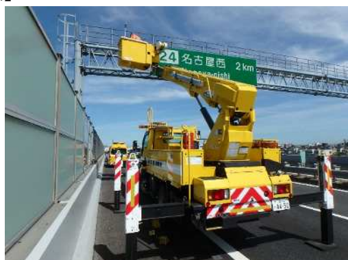
通信設備点検状況