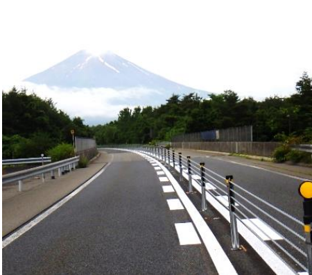
ワイヤーロープ式防護柵を 設置しました