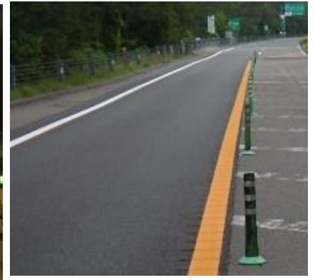
傷んだ路面を補修しました